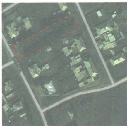
Ситуационная схема сквера со школьной аллеей